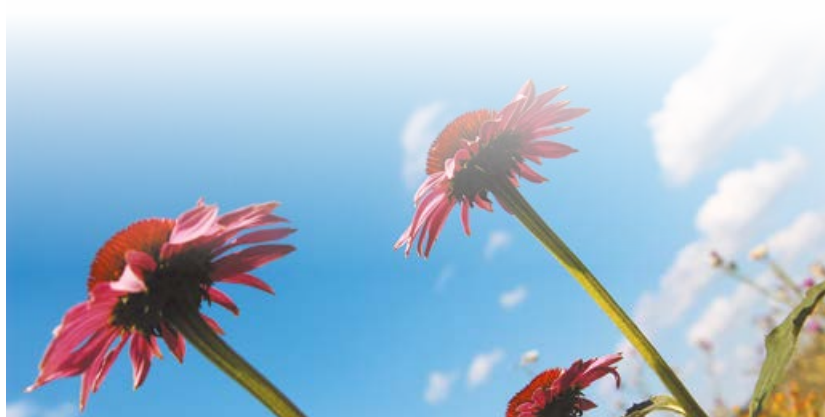
Эхинацея пурпурная на полях компании «Парафарм»