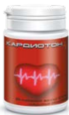
Мемо-Вит + Кардиотон