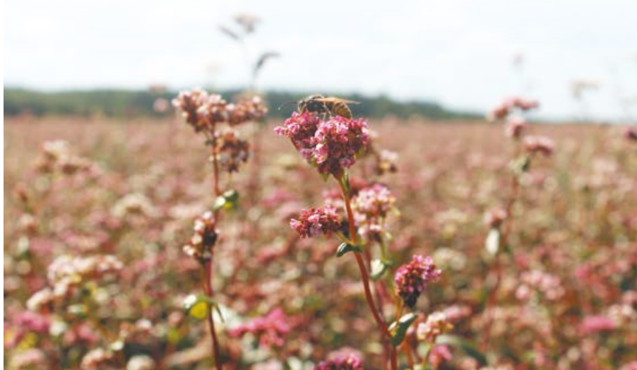
Гречиха сорта Башкирская красностебельная на полях компании «Парафарм»