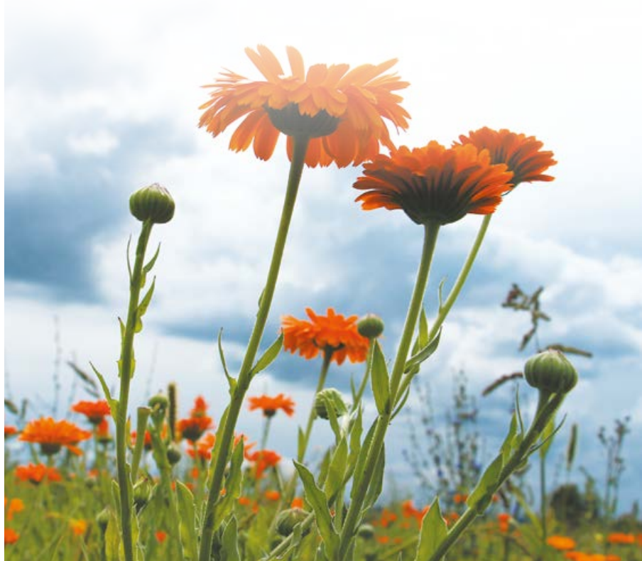
Календула сорта Кальта на полях компании «Парафарм»

Революционная технология холодной обработки лекарственных растений — криоизмельчение — позволяет использовать целое растение без потери полезных свойств в удобной для применения таблетированной форме. Технология криоизмельчения (криообработки), взятая на вооружение компанией «Парафарм», дает возможность сохранять в препаратах те свойства лекарственных растений, которые не использовались ранее из-за технологической недоступности. Целое растение обеспечивает комплексность воздействия на организм и не обладает токсическими эффектами, присущими многим экстрактам.