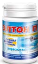
Леветон П / Элтон П