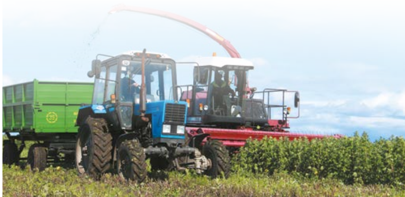
Уборка пастырьника сорта Самарский