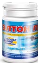
Леветон П / Элтон П