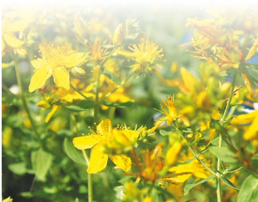
Зверобой собирается около сел Кулясово и Мамадыш в Пензенской области

СРР RU.77.99.88.003.E.004923.03.15 от 20.03.2015 г.