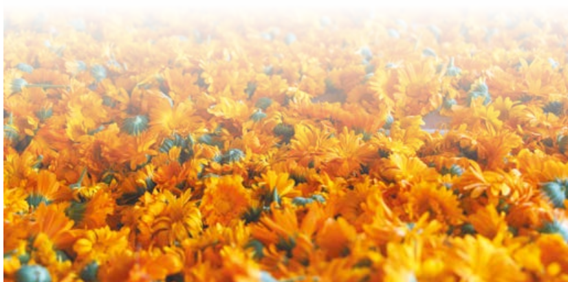
Собранная вручную календула сорта Кальта