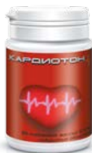
Мемо-Вит + Кардиотон